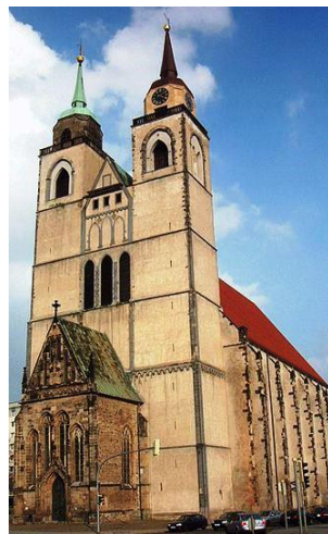
St. Johannis in Magdeburg, die Predigtkirche

Eine Leichenpredigt im engeren historischen Sinn wird als eine Trauerschrift für einen Verstorbenen umschrieben, wie sie – insbesondere in der Zeit zwischen dem 16. und 18. Jahrhundert – im protestantischen Raum verfaßt wurde und häufig in gedruckter Form herausgegeben wurde. Methodisch und inhaltlich entspricht sie häufig dem Typus einer Lob- oder Prunkrede – einem Panegyricus. Dem Motto „de mortuis nihil nisi bene“ folgend, stellen Leichenpredigten die positiven Eigenschaften des Verblichenen in den Vordergrund. Das sollte man beachten, wenn man die Texte studiert. Gleichwohl verfügten wir über ein weitaus geringeres Wissen von unseren Vorfahren, wären diese Predigten nicht gehalten und veröffentlicht worden.